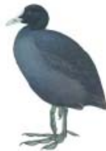
... en dit een meerkoet