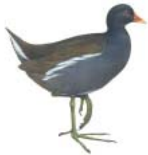
dit is een waterhoen

Deze voornamelijk zwarte watervogel met een rood voorhoofdschild en rode snavel met gele punt is een karakteristieke broedvogel van Bloeyendael. Opvallend is ook het op en neer wippen van de staart tijdens het zwemmen en lopen, zodat de witte onderstaartveren dan goed te zien zijn. Deze witte veren hebben een signaalfunctie voor hun kuikens. De schuwe vogels spelen ook nog een rol in de bloemrijke ontwikkeling van de "heemtuin" in Bloeyendael. Vooral op venige bodems kan na natte perioden zoals in deze zomer en zeker wanneer het gewas ook nog gaat liggen, een sterke ontwikkeling van mossen optreden tussen de 'hogere' planten. Soms ontstaan hele tapijten van mos. Net zoals het maaien en afhalen van het hooi belangrijk is voor het versralen van de bodem en het maken van kale plaatsen tussen de grassen om zaden van bloemplanten gelegenheid te bieden om zich te ontwikkelen is het verwijderen van dit mos ook noodzakelijk. Met het hooien lukt dit maar gedeeltelijk.