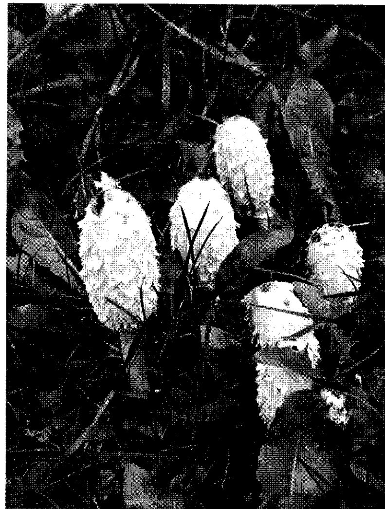
Geschubde inktzwam weer te zien