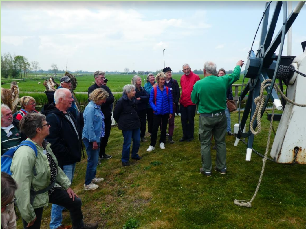
Na afloop wordt in het paviljoen het gebruikelijk buffet geserveerd.