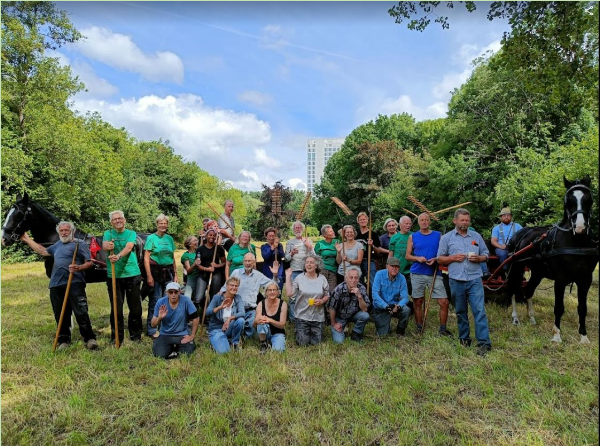
De oogst van een dag hooien: